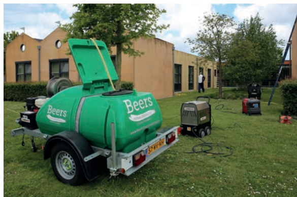
De gevels worden met een hogedrukreiniger schoongemaakt

De hoogbouw, de kern van Zuyder Waert, is al zo'n veertig jaar oud en huisvest tevens de Raad van Bestuur en meerdere diensten van Magentazorg. Het woonzorgcomplex is daar ruim twaalf jaar geleden omheen gebouwd. Deze relatief nieuwe gebouwen zijn opgetrokken uit op kleur gegoten betonnen prefabelementen. “De architect koos voor een aparte kleurstelling”, vertelt Beers. “De muren van de huisjes zijn enigszins terra en de gevels van de vleugels hebben een meer gele tint. Alles af fabriek, dus je zag verschillende kleurschakeringen en vlameffecten, maar dat gaf niet. Het mocht juist bont zijn.” Naarmate de jaren verstreken, werd de uitstraling echter minder. “Kleuren vervaagden, de gevels werden viezer, het zag er onverzorgd uit”, aldus Beers. Ook de eenheid ging verloren, daar de kleuren op verschillende ondergronden waren aangebracht: betonsteen, buitengevelisolatie en onbehandeld metselwerk.