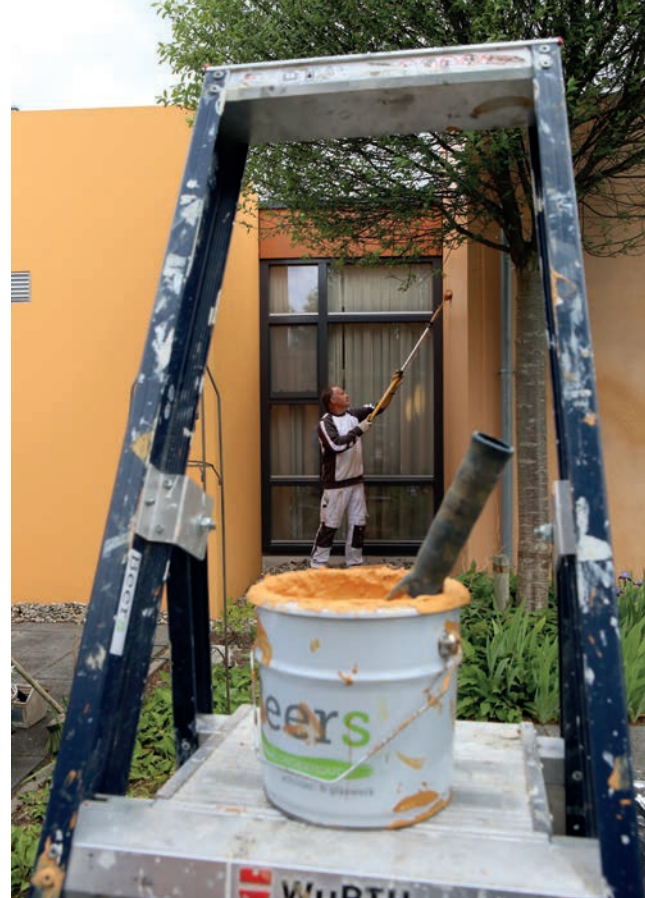
De betonnen elementen worden eerst gerold met de, op kleur gebrachte, hechtprimer CapaGrund en afgewerkt met Caparol Amphibolin