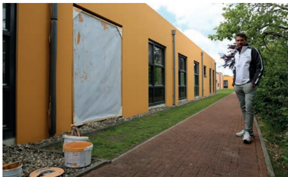
Dennis Beers toont het 'masker' waarmee ramen snel kunnen worden afgeschermd. Ook de regenpijp is tijdelijk afgeschermd met isolatiemateriaal

Als laatste worden alle gevelkozijnen afgelakt in een antraciet kleur. "Die match is heel mooi." Op de houten geveldelen komt een gesiliconiseerde hoogglans van Veveo en op de metalen vensterbanken wordt NCoat toegepast om de kleuren weer terug te halen.