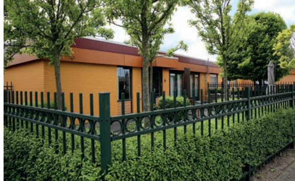
Op verschillende ondergronden, hier bakstenen, moest dezelfde uitstraling worden gekregen