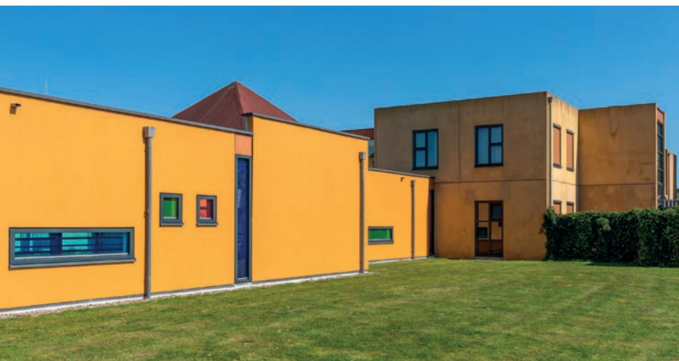
Het contrast tussen behandeld en onbehandeld is hier goed te zien

Twee personen doen de voorbereiding en de reiniging, twee anderen schilderen continu. De applicatie gaat handmatig met de roller. Beers: "Vanwege de omvang van het project - we praten over meer dan 10.000 vierkante meter - hebben we gekeken of inzet van gevoede rollers een optie was. Op de gevelisolatie en de bakstenen ging dat goed. Op de gladde betonnen elementen, de meest voorkomende ondergrond op dit werk, glibberde je echter alle kanten op. Om snel te kunnen werken, hebben we vaste kaders van hout met windreducerend doek gemaakt, zodat we geen kozijnen hoeven af te plakken."